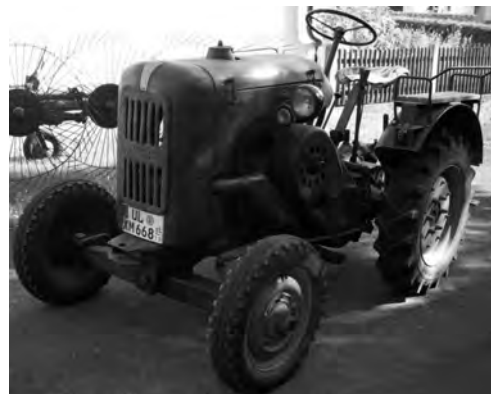
Allgaier A22 – Baujahr 1951